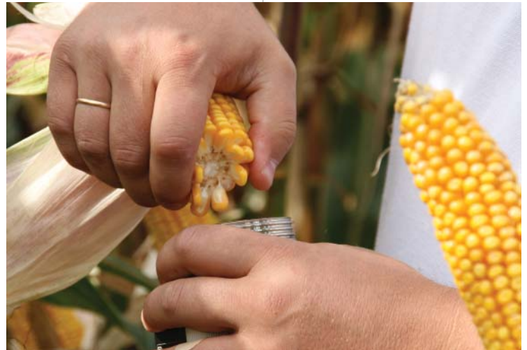
Измерение влажности, после дождя фиксировалось 26,7%