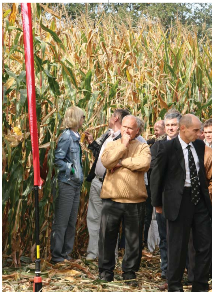
Кукуруза по высоте вдвое превосходила некоторых участников

– У нас уже есть здесь коммерческая и маркетинговая команда, следующий этап – создание научно-исследовательского центра, мы как раз этим занимаемся. Подобрать правильную селекцию для Украины, мы