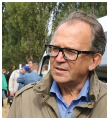
Жоэль Боссон, директор Limagrain

стве обеспечивать высокую усвояемость клетчатки животными. Хозяйства, занимающиеся животноводством, благодаря этому гибриду могут получить дополнительный потенциал. Но это гибрид формирует и довольно мощный початок – короткий, но многорядный, способный давать 10 тонн зерна с гектара. Для силосных гибридов это очень высокий показатель. Участников семинара заинтересовал также гибрид БАНГИ ФАО 240, неприхотливый в плане агротехнологий и превосходно адаптированный к зоне Полесья и Лесостепи, он способен стойко переносить неблагоприятные почвенно-климатические условия, давать большую биомассу и формировать качественный початок даже при условии дефицита тепла. Интересно, что благодаря развитой корневой системе, позволяющей растению активно осваивать почвенный профиль, гибрид отлично подходит для технологий No-till, Mini-till, способен противостоять недостатку влаги. Но особенно следует подчеркнуть, что Limagrain предлагает селекцию, корректно учитывающую условия Украины, холодного Полесья, засушливого центра. Таким стойким солдатом является, напри-