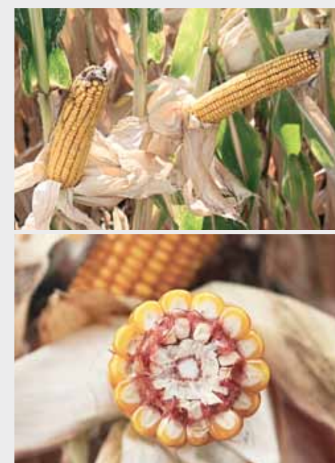
Ось вони – головні дійові особи Дня поля, кукурудза та соняшник Limagrain. Звісно, якби так потужно, як на лінійках, вони виростили на полях учасників, щастю не було б меж