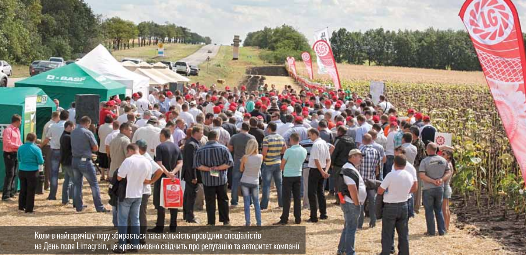
Коли в найгарячішу пору збирається така кількість провідних спеціалістів на День поля Limagrain, це красномовно свідчить про репутацію та авторитет компанії