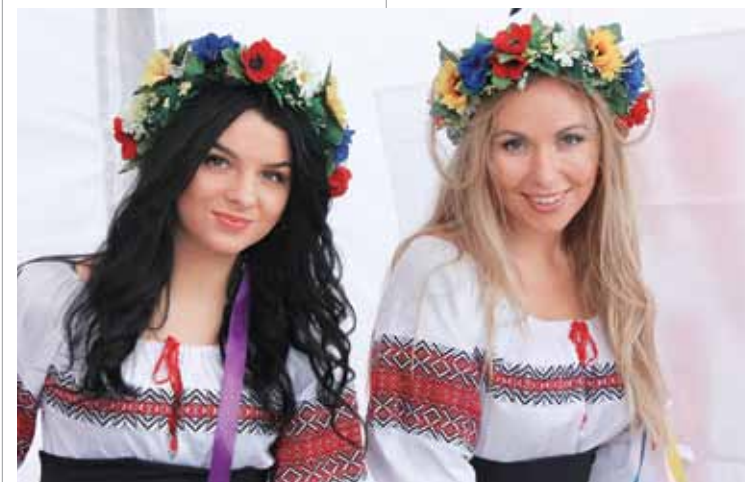
Захоплюючи емоції починалися вже на реєстрації учасників – самі погляньте, хоч по два рази реєструйся

День поля був сімейний. На Кіровоградщині, в господарстві «Покровське», зібралася велика родина тих, хто веде кооператив Limagrain в Україні, й тих, хто з ним працює, дружить, спілкується, але атмосфера була родинна, тепла, зустрічалися рідні люди.